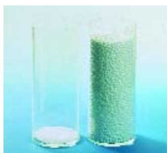
Met slechts 2% grondstof wordt 100% EPS gemaakt